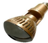
Wi-Fi Light Cam VWLC-TOV147L